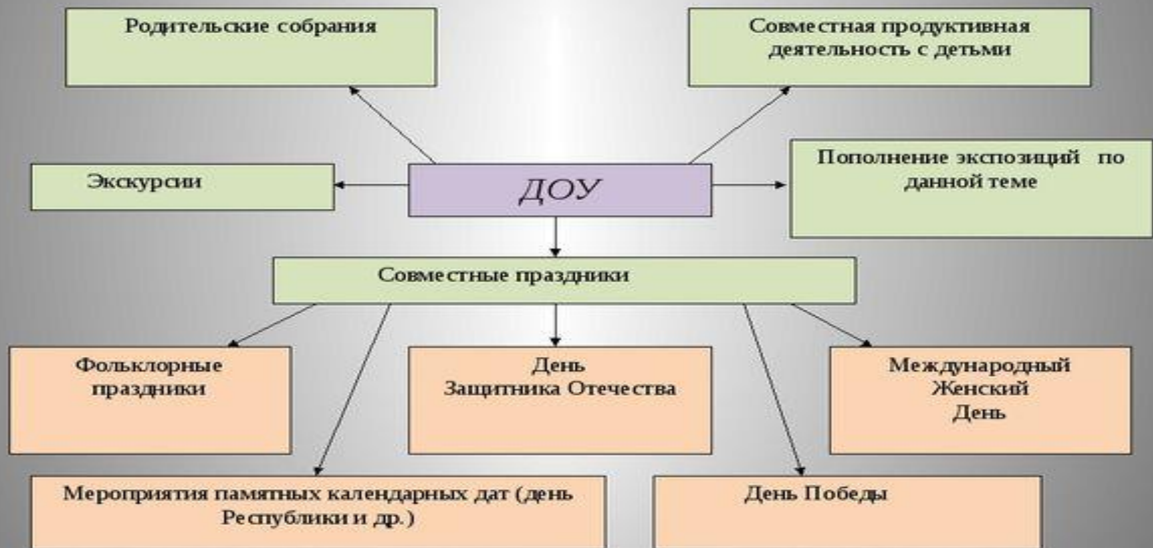
Схема сотрудничества ДООУ с родителями по нравственно-патриотическому воспитанию детей